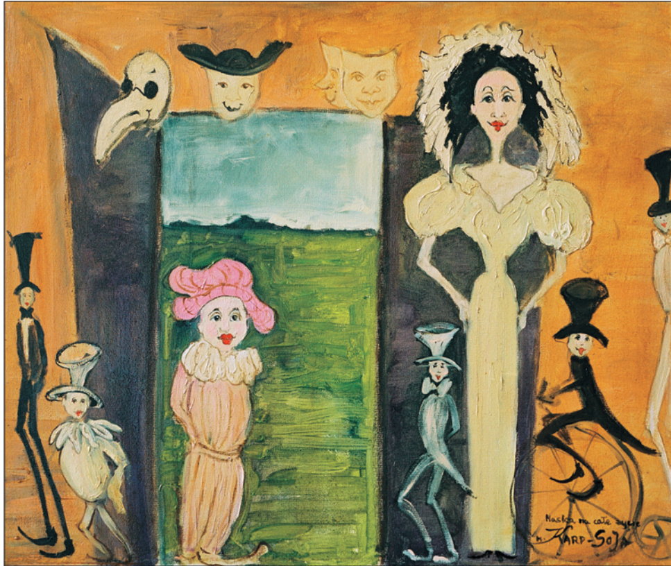
Maska na całe życie / olej na płótnie, 38x46 cm, 2005 Eine Maske fürs ganze Leben / Öl auf Leinwand The mask for life / oil