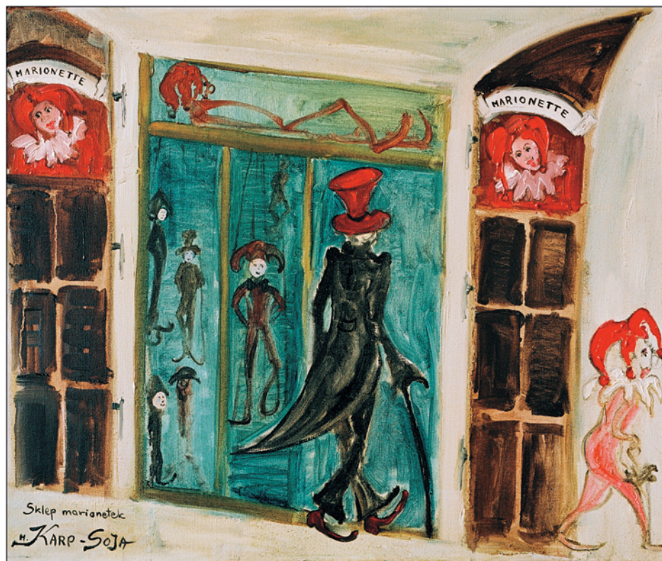
Sklep marionetek / olej na płótnie, 38x46 cm, 2005 Der Marionettenladen / Öl auf Leinwand A marionette shop / oil