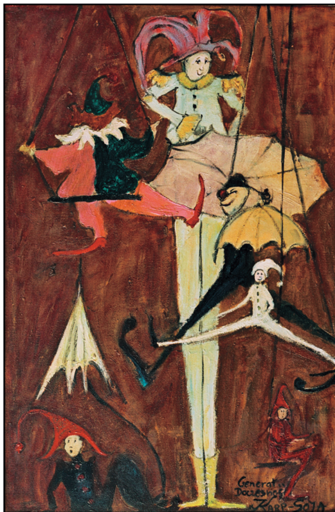
Generał doczesności / olej na płótnie, 27x41 cm, 2003

There are many scenes of manorial and bourgeois life, genre scenes from the life of the aristocracy, in which high-society figures mingle in a dreamy atmosphere filled with fairy-tale gardens, flowers, palace arbours, gates and stone plinths. The flower compositions are in the spirit of the Art Nouveau, sometimes reminiscent of small-size stained-glass windows. Personification is evident here. The painting portraying flower-masks alludes to the visionary drawings and graphic works of Odilon Redon. But, first and foremost, it is an allegory of the artist's personal penchant for the subconscious, from the darkness of which she conjures up grotesque constellations of faces, real and unreal phantoms, clowns and elves which have come down to us from the mysterious beyond. Exoduses and processions of figures portrayed in an ancient setting, are pacing through circus arenas, theatrical stages and suburban areas in dancing circles or else are creating images which symbolise the vanity of all human endeavours. What remains is a nostalgia for a beauty that never passes, for a lost childhood, for the joy of being part of the magical circus of life.