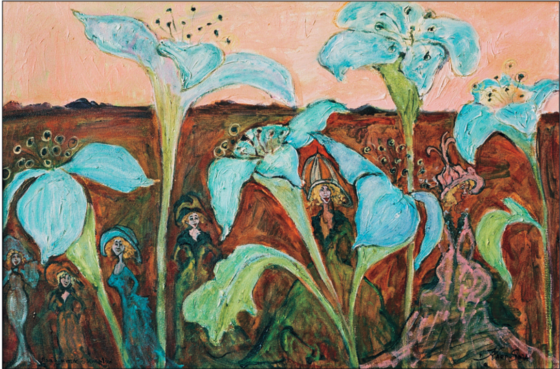
Magia wróżek i kwiatów / olej na płótnie, 40x60 cm, 2005 Magie der Feen und Blumen / Öl auf Leinwand The magic of good witches and flowers / oil