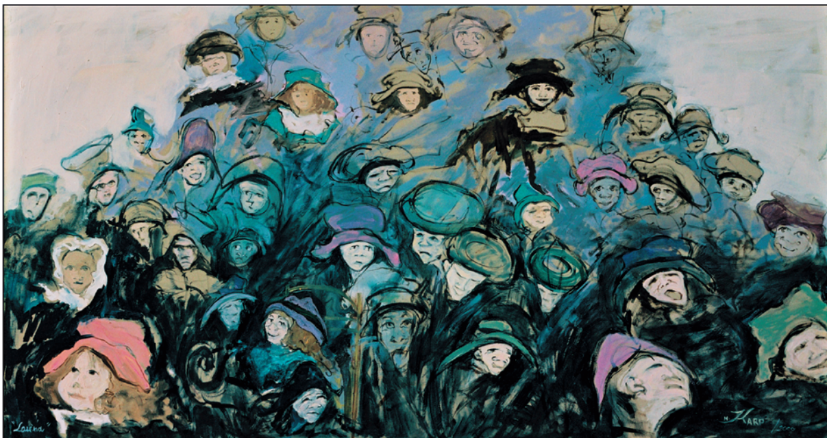
Lawina / olej na tekturze, 40x75 cm, 2000 Die Lawine / Öl auf Pappe Avalanche / oil