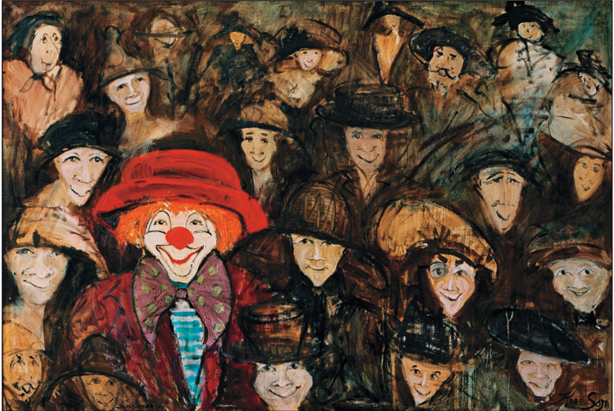
Blížej radosti / olej na plótnie, 60x90 cm, 2002 Näher zu der Freude / Öl auf Leinwand Closer to joy / oil