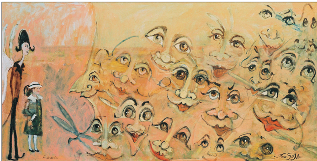
W zderzeniu / olej na płótnie, 40x80 cm, 2004 Ein Zusammenstoß / Öl auf Leinwand Clashing / oil