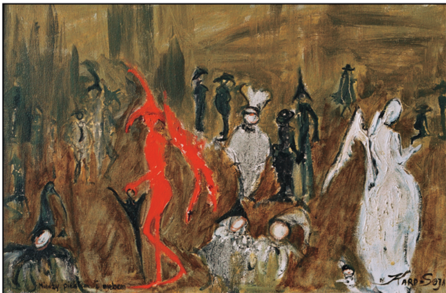
Między piekłem i niebem / olej na płótnie, 27x41 cm, 2003 Zwischen Himmel und Hölle / Öl auf Leinwand Between heaven and hell / oil