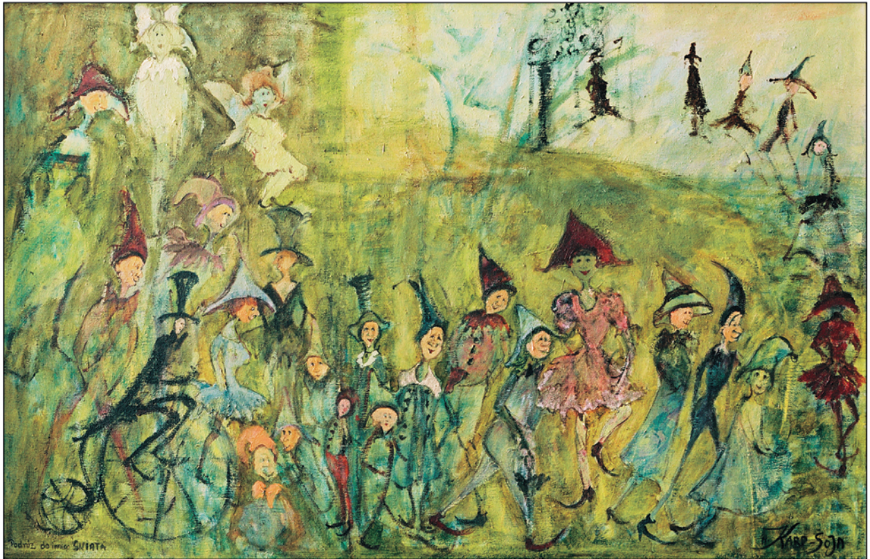
Podróż do innego świata / olej na płótnie, 55x85 cm, 2004 Reise in eine andere Welt / Öl auf Leinwand A journey to a different world / oil