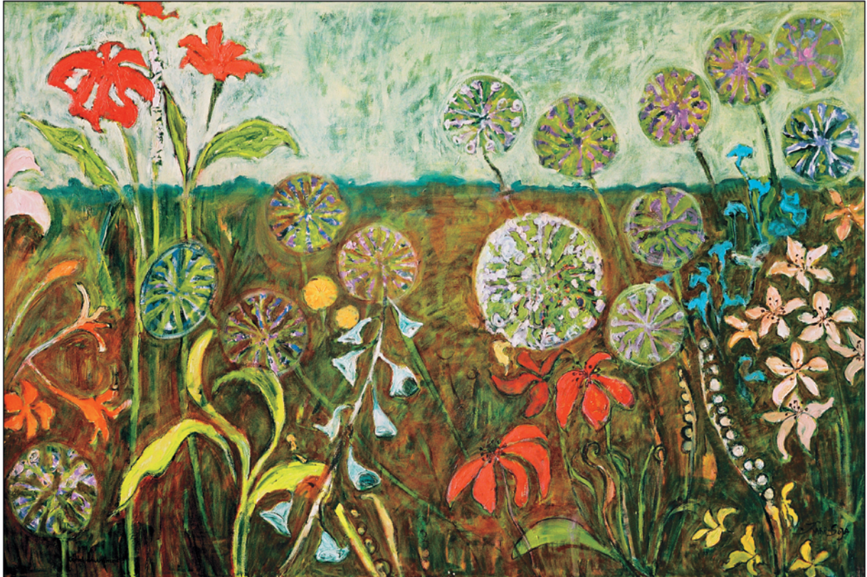
Ogród dmuchawców / olej na płótnie, 80x120 cm, 2005 Der Löwenzahngarten / Öl auf Leinwand A dandelion-clock garden / oil